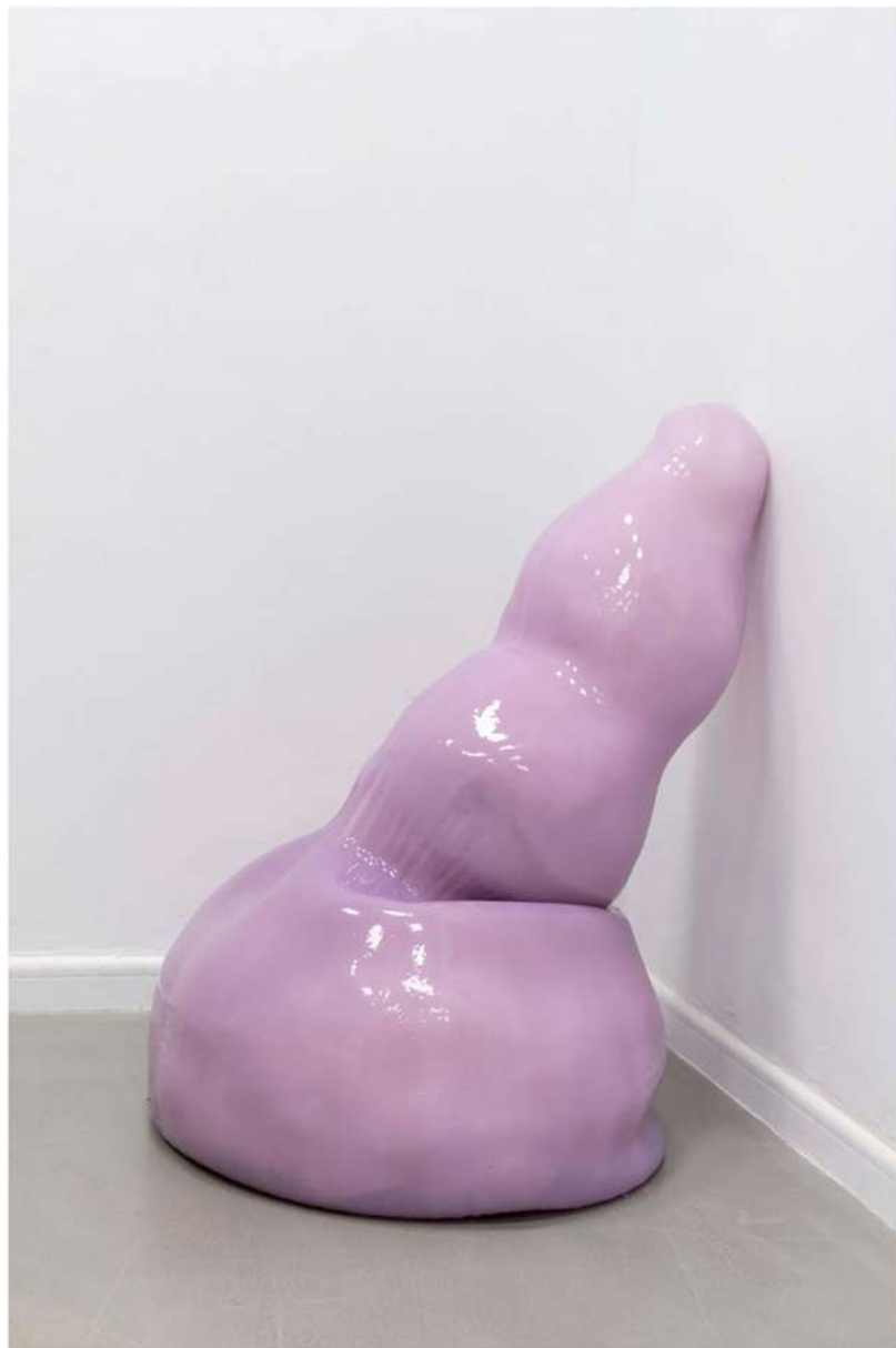
Obra de Ana Fábregas en el espacio de Bombon Projects en ARCO 2023 ROBERTO RUIZ