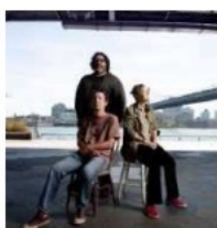
Yo La Tengo fêtera ses 40 ans l'an prochain. GERY LOUIN

Le trio américain Yo La Tengo est de retour à Bordeaux où il n'a plus joué depuis un quart de siècle