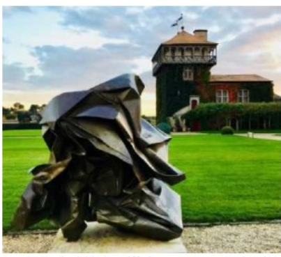
Pour BAD+, des initiatives déferlent un peu partout dans la ville jusqu'aux propriétés viticoles alentour. Ici, le château Smith Haut Lafitte.