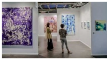
Le salon BAD+ en juillet 2022 au Hangar 14.

Parmi la pléthore de propositions : des œuvres d'art brut juxtapuées et de très rares sculptures en liège réalisées par Joaquim Vicens Gironella (1919-1997), fils d'ouvrier bouchonnier repéré par Jean Dubuffet et André Breton (à la galerie Christian Bèrzi) ; d'envoûtantes atmosphères chromatiques signées Charles Pol-