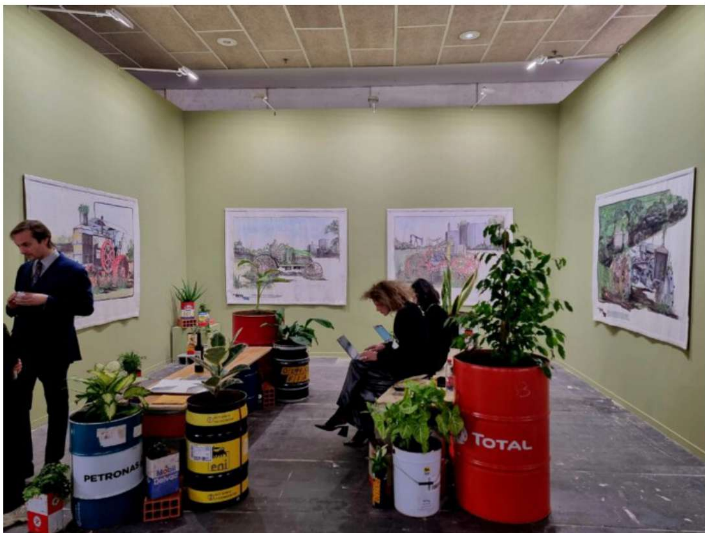
Arco Madrid 2023, Madragoa

Due grandi progetti dell'equadoregno Adrian Balseca (Quito, 1989), e siamo sempre nella 'sezione sudamericana' della fiera. Come suo solito si parla di sfruttamento di risorse e territori. Da una parte con degli arazzi che scimmiettano vecchie pubblicità di trattori e macchine agricole ricollocati, pur mantenendo la grafica originale, in contesti di sfruttamento. Dall'altra con una installazione in cui barili di petrolio, benzina e carburante vengono trasformati in vasi di piante che trasformano lo stand in una giungla rigogliosa di piante da interno. La galleria di Lisbona, fondata e gestita da italiani, tra una fiera e l'altra sta procedendo a un cambio di sede in città tutto da seguire.