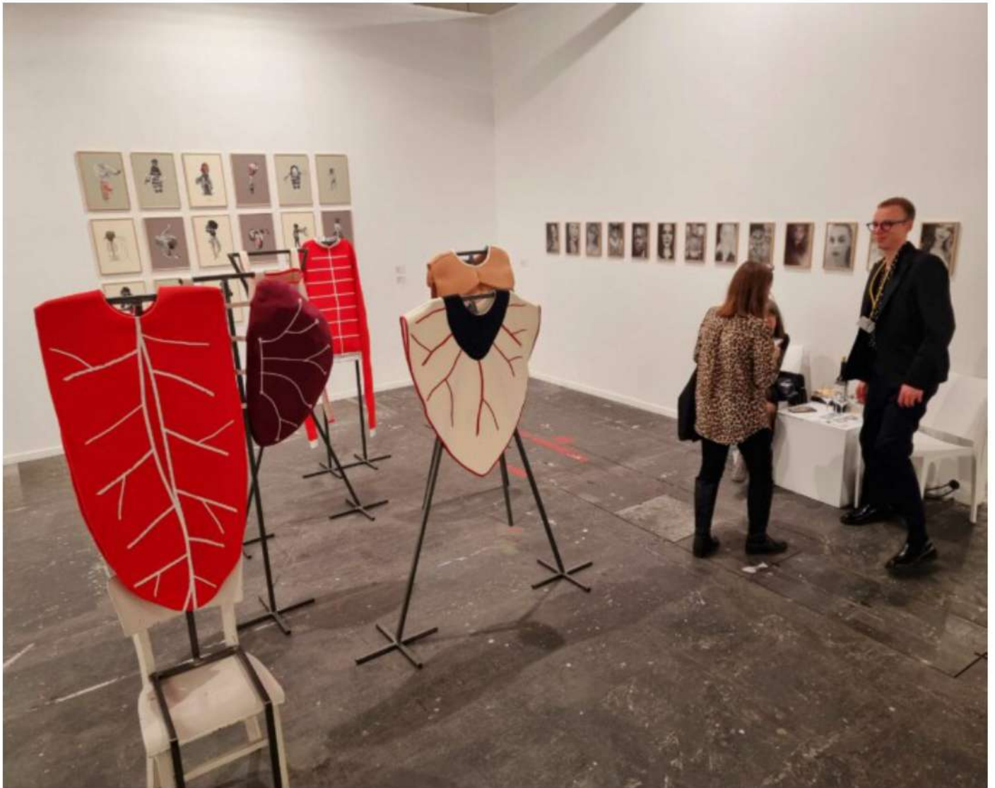
Arco Madrid 2023, Hunt Kastner

In questa galleria di Praga un curioso progetto di tessuti e collage di Eva Kotatkova (Praga, 1982). I tessuti richiamano a organi interni (cuore, polmoni...) e sono realizzati come zainetti indossabili. L'artista era apparsa anche qualche anno fa per una mostra al Pirelli Hangar Bicocca di Milano. Interessanti anche le nuove foto di Jiri Skàla esposte su una parete.