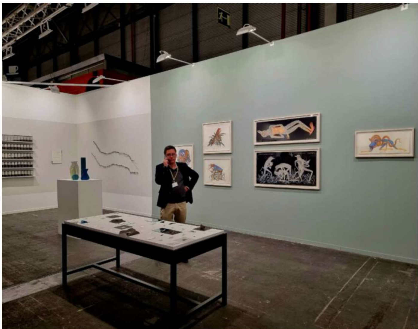
Arco Madrid 2023, Arroniz & Nueveochenta