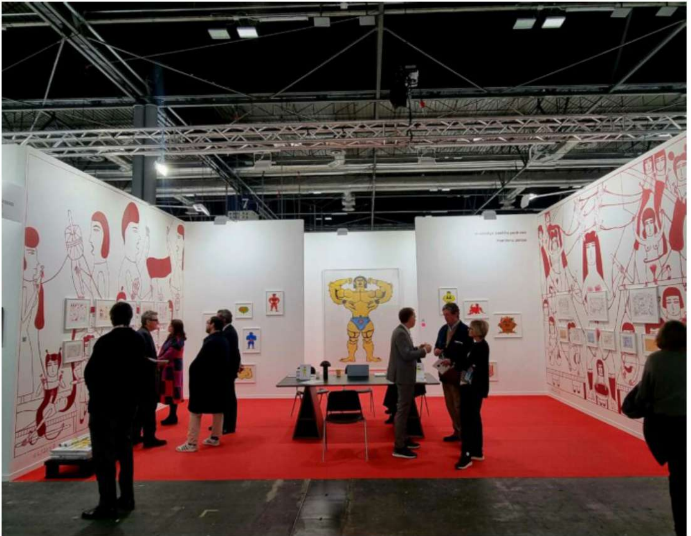
Arco Madrid 2023, Christian Berst