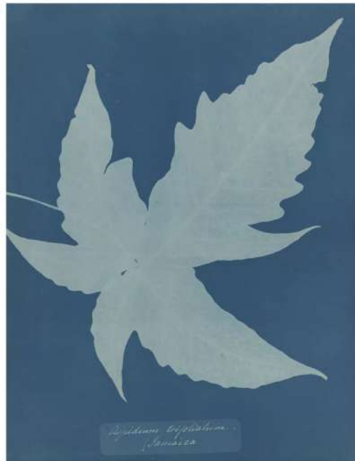
Aspidium Trifoliatum (Jamaica), photogramme cyanotype, d'Anna Atkins (1851-1854).

Le gros de l'offre au Grand Palais éphémère reste classique. Noir et blanc dominant avec des vintages omniprésents, cette année, et souvent hors de prix, comme les valeurs sûres du marché aux enchères de New York. À l'image des catalogues de ventes. Place aux grands noms de l'histoire de l'art, d'Irving Penn ( Mouth for L'Oréal , 1986, 450.000 € pour une édition de 28, chez Hamiltons de Londres!) à Imogen Cunningham. La collection Lepage, vendue chez Millon ce jeudi 10 novembre au soir, le confirme avec ses 40 tirages argentiques sur papier salé de Nadar, dont le merveilleux Pierrot à la corbeille de fruits , 1854-1855, qui a inspiré directement le Baptiste des Enfants du Paradis .