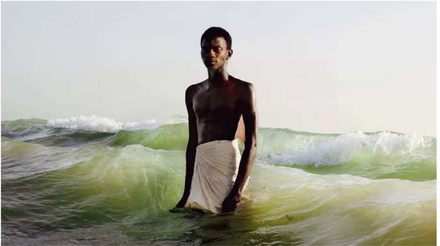
Stake out , de la série «Drown In My Magic», de David Uzochukwo (2019).

DÉCRYPTAGE - Pour sa 25 e édition, la foire joue la carte des grands classiques plus que des révélations. Le noir et blanc domine, jusqu'à dimanche au Grand Palais éphémère, pour un marché qui veut séduire les États-Unis. Visite.