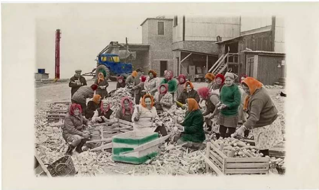
Femmes travailleuses , tirage gélatino-argentique teinté et colorisé à la main, de Viktor & Sergiy Kochetov (1978).

Paris Photo n'a pas encore fait sa mue contemporaine, comme les Rencontres d'Arles avec son directeur Christoph Wiesner, ancien directeur artistique de Paris Photo, qui a mis les questions de société, de genres, d'écologie et de migrations beaucoup plus en avant, quitte à refroidir les fidèles. Hormis le parcours éclectique de Rossy de Palma , aux étiquettes croquées à main levée par l'artiste espagnole mais à peine visibles. Sans suivre les codes du marché, elle a choisi au coup de cœur des photos sensuelles, principalement de femmes ( Female torso with Veil , Paradise Cove, 1984 de feu Herb Ritts chez l'Américain Edwynn Houk).