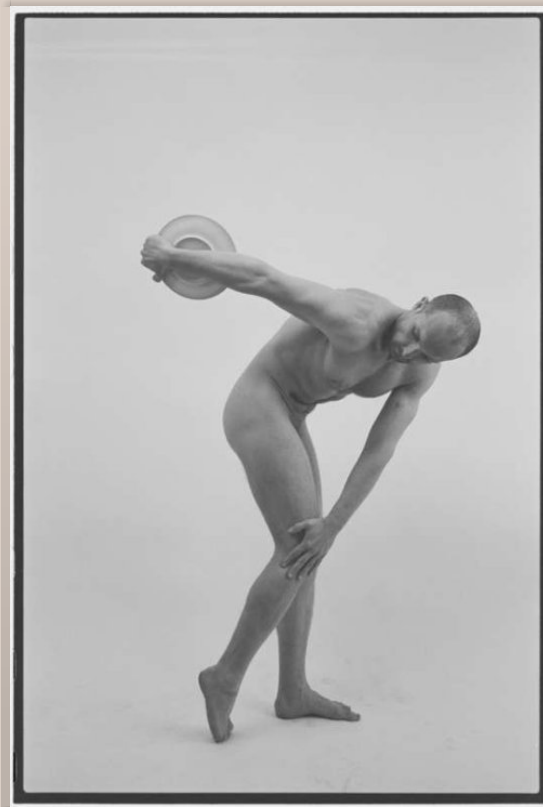
Luboš Plný, discobole, tirage argentique