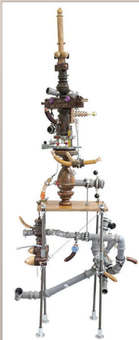
Luboš Plný, sans titre, objet érotique

Ces expériences — parfois douloureuses — sur son propre corps constituent une manière très personnelle de méditer, en utilisant un protocole créatif immuable dans l'espoir de ponctuer ou scander le temps : il mesure en temps réel le temps utilisé pour les parcelles qui constituent ces œuvres ainsi que l'instant de ses créations. Ainsi, comme des données topographiques, apparaissent des chiffres, comme autant de codes référençant avec précision l'instant de création et la durée nécessaire à la réalisation des zones de l'œuvre, délimitées par des lignes qui ne représentent ni les coordonnées, ni l'altitude d'un lieu, mais sa place exacte dans le temps. C'est un journal qu'il poursuit au quotidien explique Luboš Plný. L'artiste inscrit soigneusement le nombre de jours qu'il a à la date du début de l'œuvre et son âge — toujours en jours — à la fin de l'œuvre, comme le rappel d'une inexorable approche de la Mort.