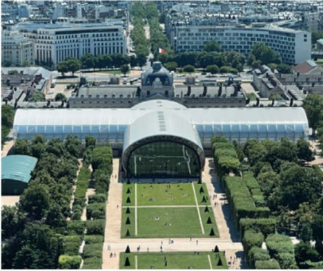
Le Grand Palais Éphémère.