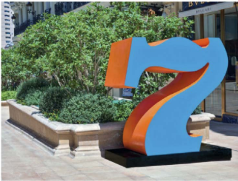
Robert Indiana, Seven .