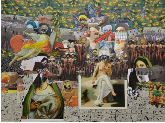
Ramin Haerizadeh, Untitled , 2012, technique mixte sur toile, 150 x 200 cm.

— L'Iranien Ramin Haerizadeh nous avait habitués à jouer les mouches du coche en apparaissant barbu et affublé d'un tchador dans ses tableaux de plus en plus morcelés, livrant un état kaléidoscopique, quasi schizophrène, de la société iranienne. Dans la nouvelle série de collages présentée chez Nathalie Obadia, à Paris, l'artiste n'a rien perdu de son irrévérence ni de son goût de la fragmentation. Mais il a puisé de la sève dans d'autres iconographies, notamment en s'appropriant l'histoire de l'art occidentale via des copies malhabiles achetées à Dubaï. À coup de télescopes et de courts-circuits visuels, il larde les reproductions des grands maîtres italiens d'images prises dans les medias et la publicité. S'il poursuit sa diatribe contre les dictatures et leur traque du plaisir féminin (et masculin), il n'en taquine pas moins les rêves révolutionnaires, qui finalement escamotent des dictateurs laïcs et tyranniques au profit de régimes islamiques. En associant une iconographie libératrice issue du siècle des Lumières à des photos de manifestations de Mai 68 et des clichés de débordements (un drapeau américain brûlé) pris à Téhéran avant l'avènement de Khomeiny, il souligne aussi l'égarément de nombreux intellectuels hexagonaux qui ont confondu spiritualité politique (incarnée par les anges à la Giotto) et obscure théocratie menant à ces silhouettes de femmes-corbeaux voilées de noir... À méditer. ■