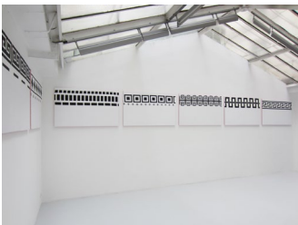
Vue de l'exposition de Nicolas Chardon « Frises et ornements », à la Galerie Jean Brolly, Paris.

— Depuis toujours, Nicolas Chardon chahute l'alphabet des avant-gardes en leur retirant sa stricte géométrie. Sa méthode : tendre sur châssis un tissu Vichy ou écossais, le recouvrir d'un apprêt blanc laissant deviner la trame en filigrane, et suivre les lignes devenues flottantes et chaloupées. Les carrés semblent bégayer, la géométrie est soudain prise de tressautement. Dans la nouvelle série de frises exposées à Paris chez Jean Brolly, l'artiste pousse plus loin l'insolence en s'appropriant l'ornement, jugé tabou par les artistes modernes. Du répertoire ornemental, il n'a conservé que des formes simplifiées, des motifs tellement évidés qu'il en résulte parfois de curieux résultats, proches des pictogrammes des jeux vidéo. ■