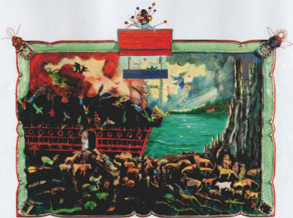
Parmi la collection de Treger et Saint Silvestre présentée à Sao Joao, des œuvres sans titre de Giovanni Podesta (ci-dessus), PLNY (ci-contre), Friedrich Schröder-Sonnenstern (ci-dessous).