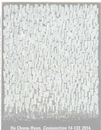
Ha Chong-Hyun. Conjunction 14-133, 2014.