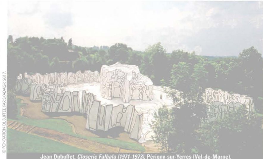
Jean Dubuffet, Closerie Falbala (1971-1973) , Périgny-sur-Yerres (Val-de-Marne).