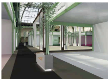
Préfiguration de la prochaine édition de la Biennale Paris au Grand Palais, à Paris.

La Biennale Paris et le Syndicat national des antiquaires (SNA) qui l'organise, ont décidé de mettre en place un dispositif inédit d'aides aux marchands ayant prévu de participer à son édition 2020, qui doit se tenir au Grand Palais du 18 au 22 septembre. L'objectif : soutenir les professionnels qui souffrent d'un contexte économique difficile à cause de la crise sanitaire. Pour ce faire, la Biennale Paris propose à ses exposants d'échelonner les frais de participation sur quatre mois après le déroulement de l'événement, sans compte à avancer. Afin de financer ces mesures, les organisateurs s'appuient sur le dispositif de garantie de l'État pour les prêts accordés aux entreprises impactées par le Covid-19. Le président de la Biennale Paris, Georges de Jonckheere, a rappelé que « la santé des exposants, des équipes et des visiteurs est l'élément déterminant pour nous. La Biennale Paris n'aura lieu en septembre que si toutes les conditions de sécurité sont réunies sur le plan sanitaire, dans la stricte application des recommandations des autorités sanitaires nationales et internationales ». A. Co. www.labiennaleparis.com