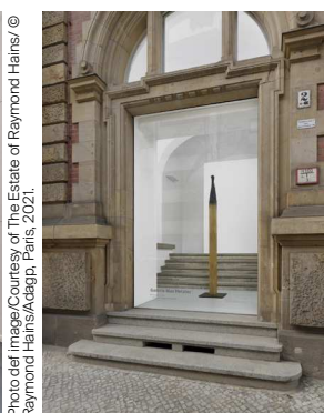
Raymond Hains, Allumette géante brûlée , 2005, vue d'installation à la galerie Max Hetzler pour l'édition 2021 de Gallery Weekend à Berlin.