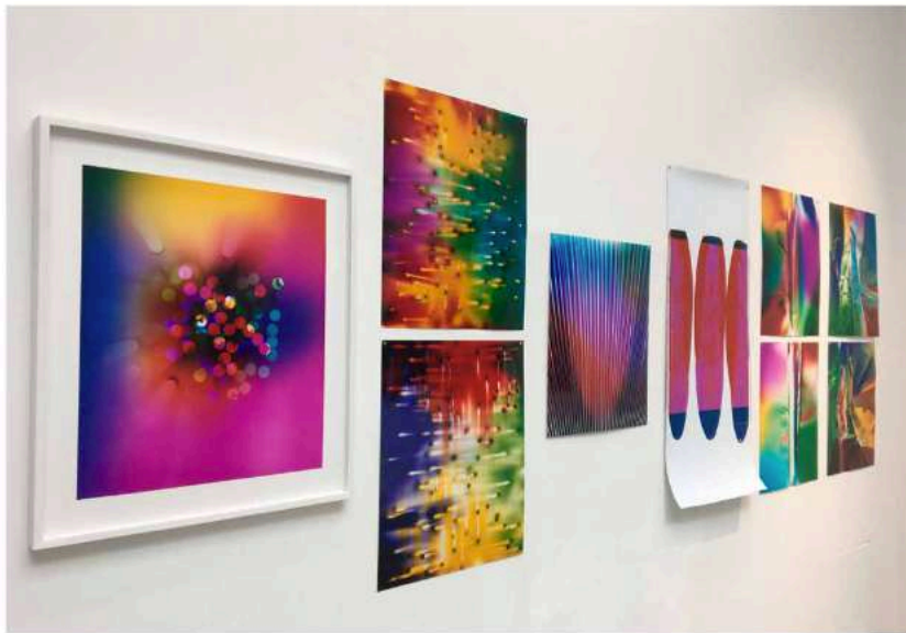
Œuvres de Ellen Carey, Galerie Miranda, Espace Bertrand Grimont.

A PROCHÈRE A ACQUIS UNE RÉPUTATION DE SALON DÉFRICHEUR D'UNE «TERRA INCOGNITA» À LA LISIÈRE DE L'EXPÉRIMENTATION PHOTOGRAPHIQUE ET DE LA CRÉATION PLASTICIENNE