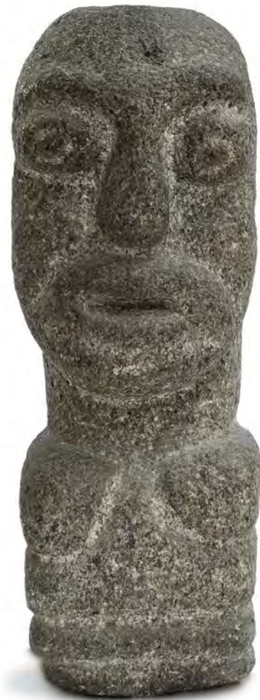
Antoine Rabany dit Le Zouave, Sculpture Barbu Müller,