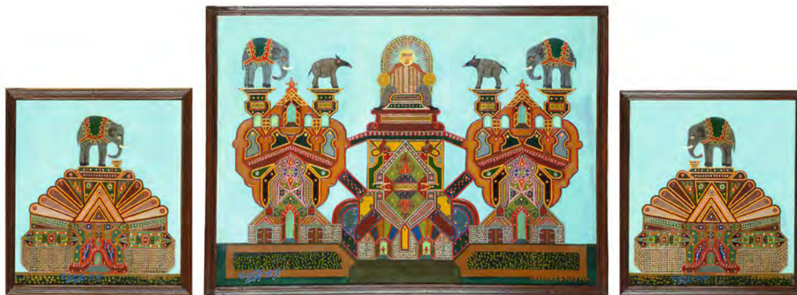
Fleury-Joseph Crepin, Sans titre,

1941, huile sur toile, élément central 61 x 89 cm, éléments latéraux 40,5 x 39 cm.