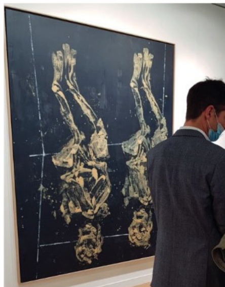
Œuvre de Georg Baselitz de 2018 sur le stand de la galerie White Cube.

186 AVENUE VICTOR HUGO 75116 PARIS PARISINTERNATIONALE.COM