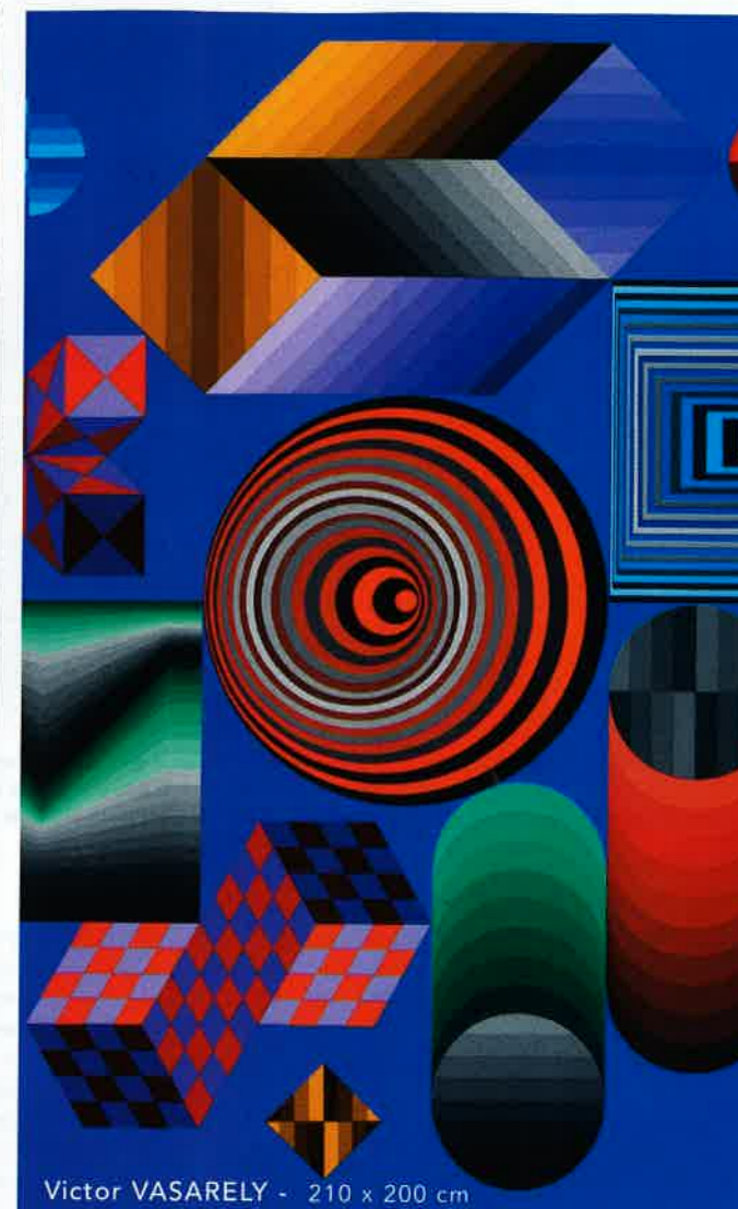
Victor VASARELY - 210 x 200 cm