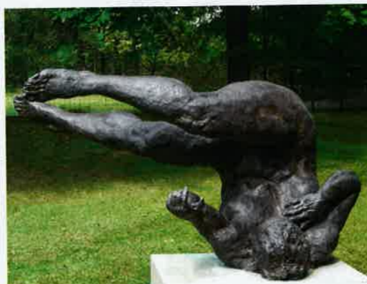
Tumbling Woman (2002), Eric Fischl. Cette œuvre de l'artiste américain, commémorant les vies perdues du 11-Septembre, a choqué aux Etat-Unis. Elle est exposée au jardin des Tuileries, dans le cadre de la Fiac hors les murs.

tions sociales, esthétiques, architecturales et politiques du XX e siècle. » Il exposera notamment des pièces uniques réalisées par les architectes Jean Prouvé et Charlotte Perriand et le designer Ron Arad, qui offriront un éclairage différent sur la modernité que celui proposé par les autres stands. Mais il ne sera pas le seul au vu de la multiplicité des lieux, des expositions et des événements organisés par et autour de la Fiac lors de cette grande semaine.