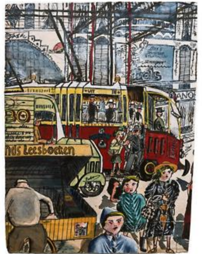
Willem van Genk, A Fantasy on the Groningen Regional Day, vers 1950, dessin à la plume et à l'encre, 27,5 x 21,1 cm. œuvre en vente à Art Paris 2022.