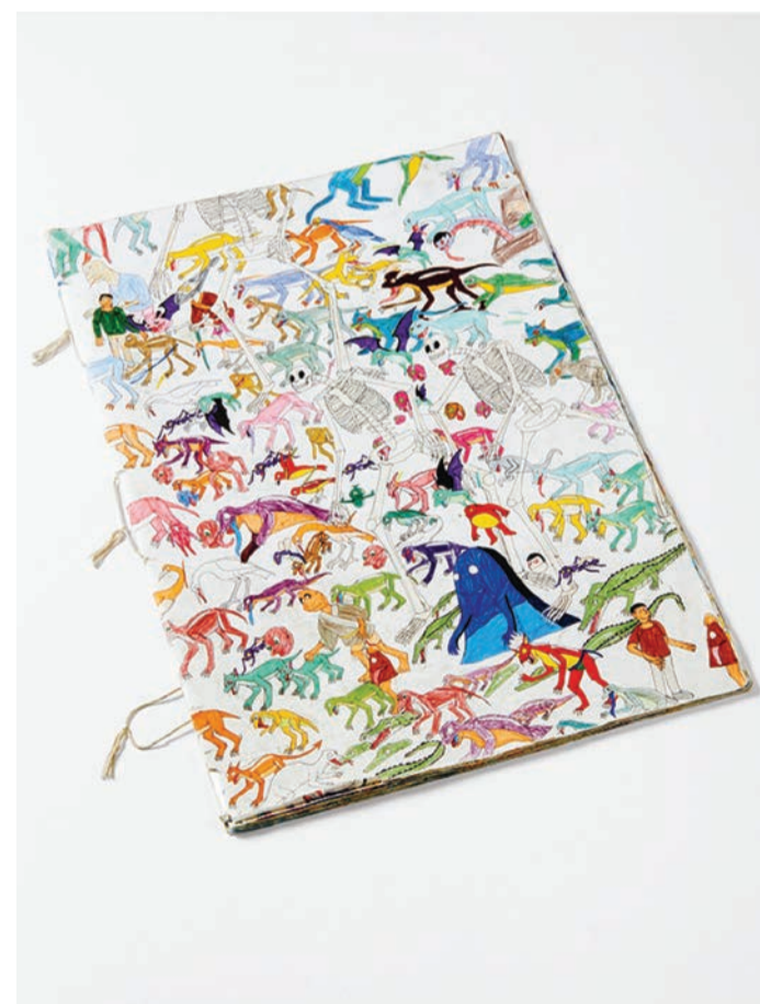
Yuichiro Ukai, cahier de dessin 20 pages, 2017, technique mixte sur papier, 54,5 x 38 cm