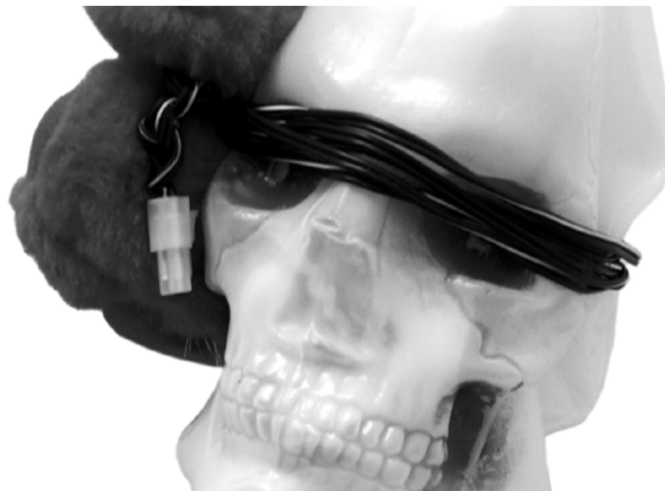
l'artiste italien franco bellucci exposé au núcleo de arte da oliva jusqu'au 14 octobre 2018.

édition revue et augmentée du catalogue bilingue (FR|EN) janko domšic : le mécanicien céleste, 130 p.