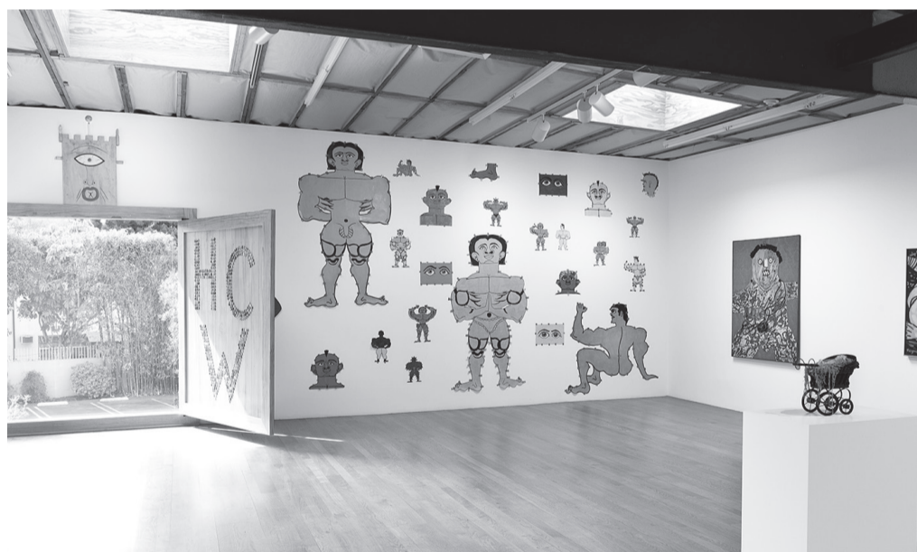
misleidys castillo pedrosa dans new images of man à la galerie blum & poe, los angeles

Conçue et lancée en 2009 avec un consortium de galeries commerciales et à but non-lucratif partageant les mêmes valeurs, cette foire hybride rassemblera cette année plus de 60 exposants internationaux.