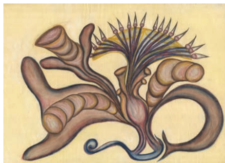
sans titre, circa 1965. pastel sur papier, 62.5 x 88 cm.