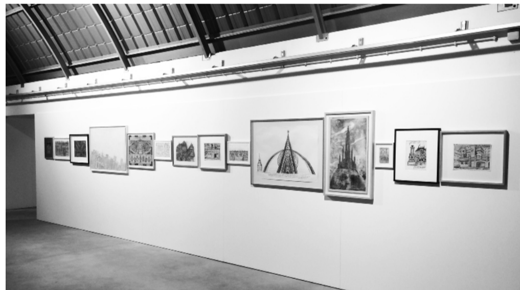
vue de l'exposition les lois du nombre d'or , oliva creative factory, portugal