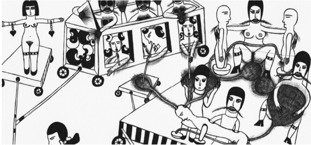
marilena pelosi, détail