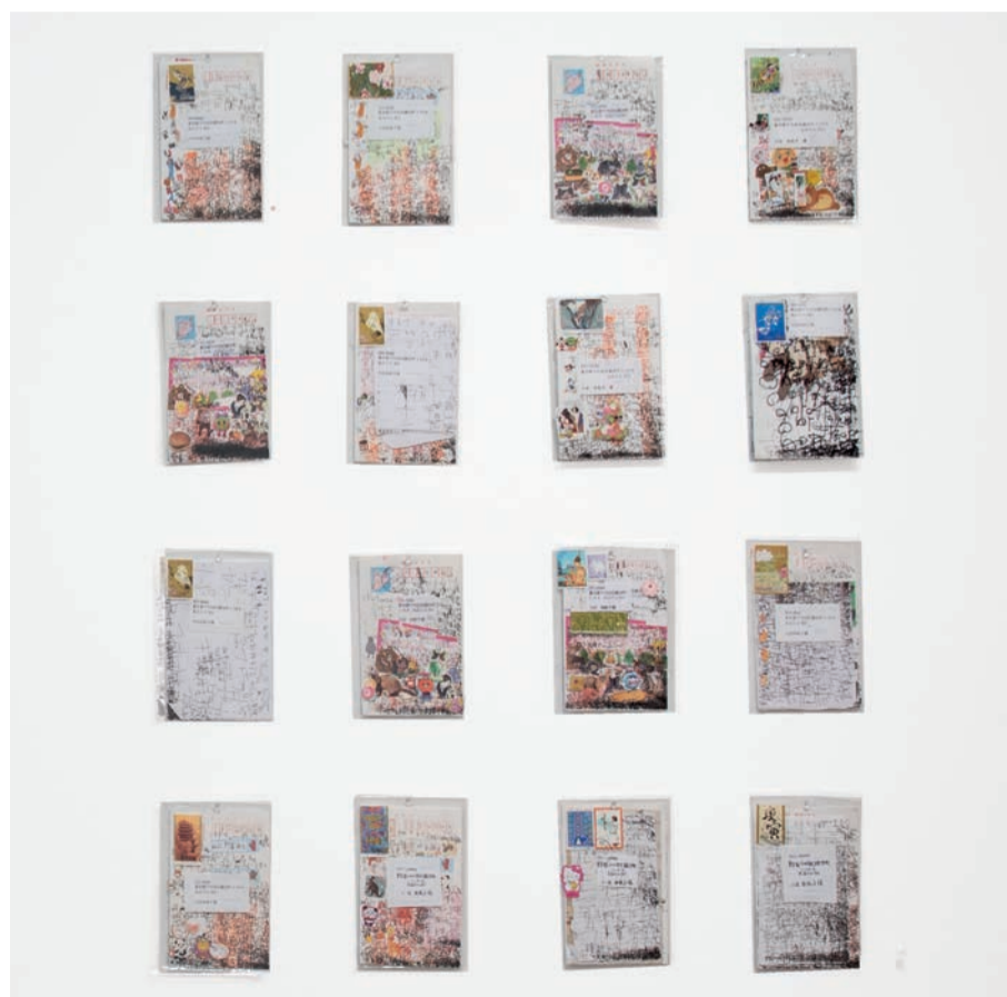
vue de l'exposition do the write thing #3, christianberst art brut, Paris, 2022.