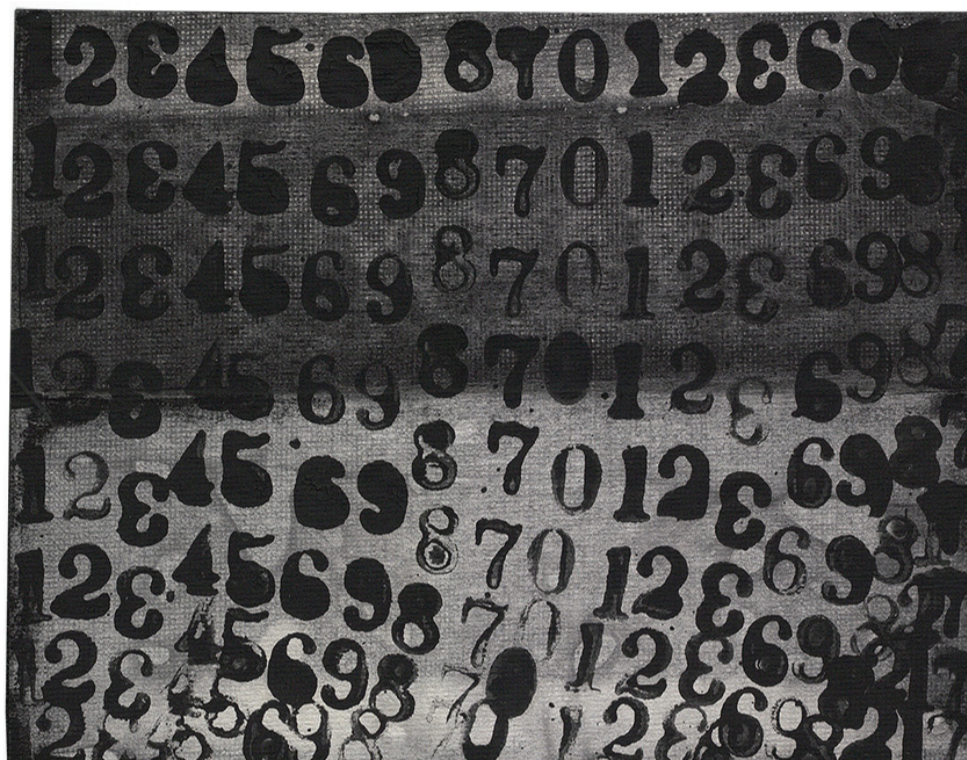
Momoko Nakagawa, sans titre, 2020, tampon et acrylique sur serviette en papier, 17 x 21.8 cm

Pour cette deuxième édition du Salon BAD + Bordeaux + Art + Design, qui se tiendra au Hangar 14 au bord de la Garonne, du 5 au 7 mai 2023, la galerie présentera (stand R+1 52) les œuvres de six artistes contemporains japonais.