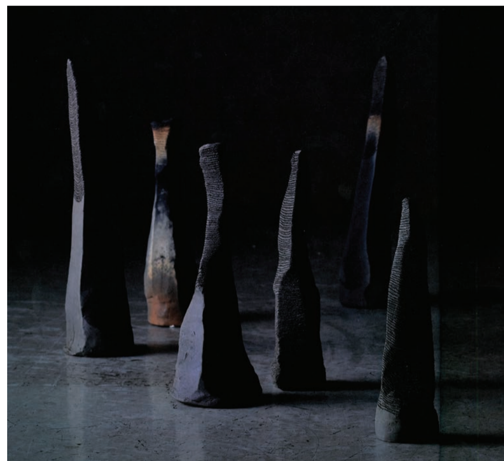
Sculptures d'Hideaki Yoshikawa, artiste présenté lors de la foire BAD+ au mois de mai (voir verso)

La galerie prête pas moins de trente six œuvres de l'artiste polonais Tomasz Machciński au centre photographique