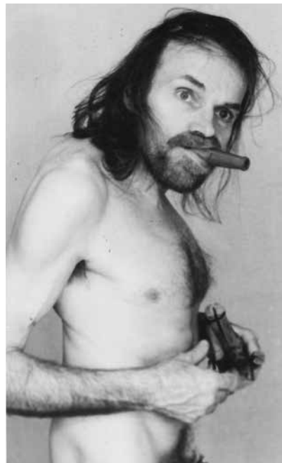
tomasz machciński, sans titre, c. 1995, tirage argentique vintage (1/1)