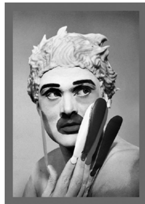
chrysalide: le rêve du papillon édition française septembre 2023