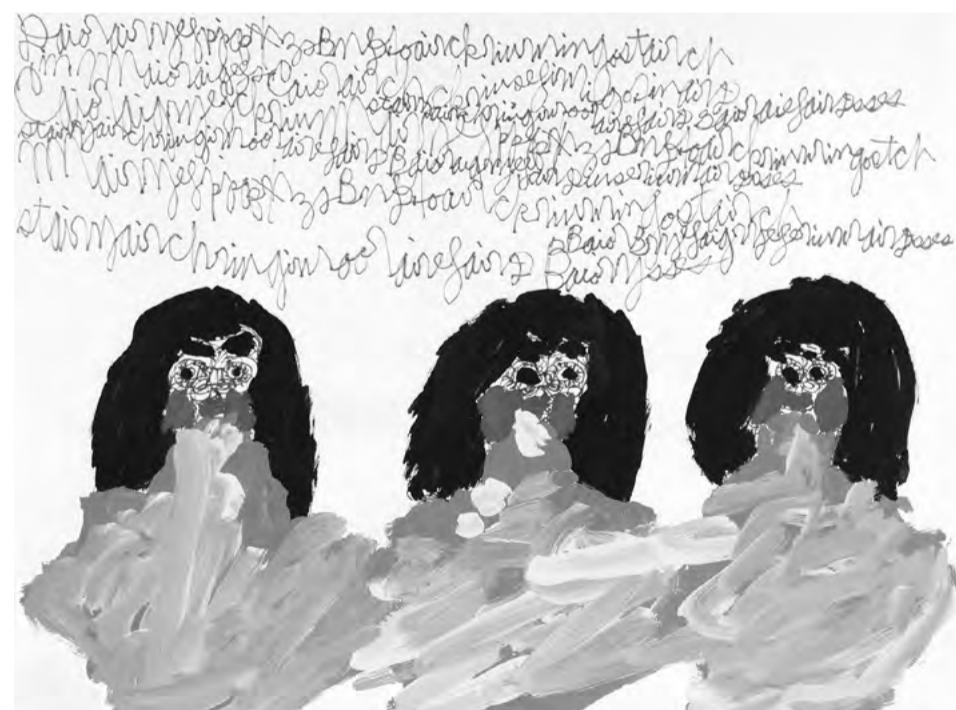
sans titre, 1980. encre et détrempe sur papier, 43 x 58 cm

“O 'espírito singular' da Arte Bruta passa também pela fotografia” par Alexandra Prado Coelho in Publico , 30 mars 2024.