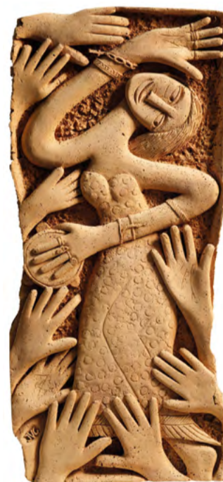
J. V. Gironella, désir (rythme flamenco), c. 1970, liège, 97 x 41 cm