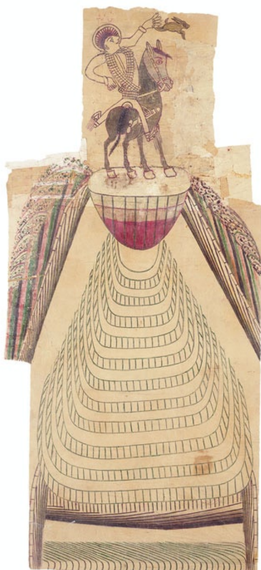
Martin Ramirez sans titre, circa 1955. Mine de plomb, crayon de couleur, charbon de bois et collage sur papier, 142 x 68.5 cm

21 octobre au 29 novembre 2014 vernissage samedi 18 octobre de 18h à 21h