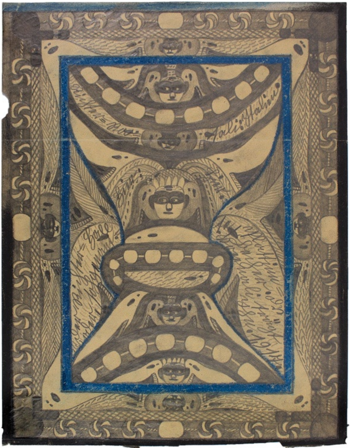
adolf wölfli. sans titre, recto verso, 1917. crayon de couleur et crayon sur papier, 40.5 x 31.2 cm