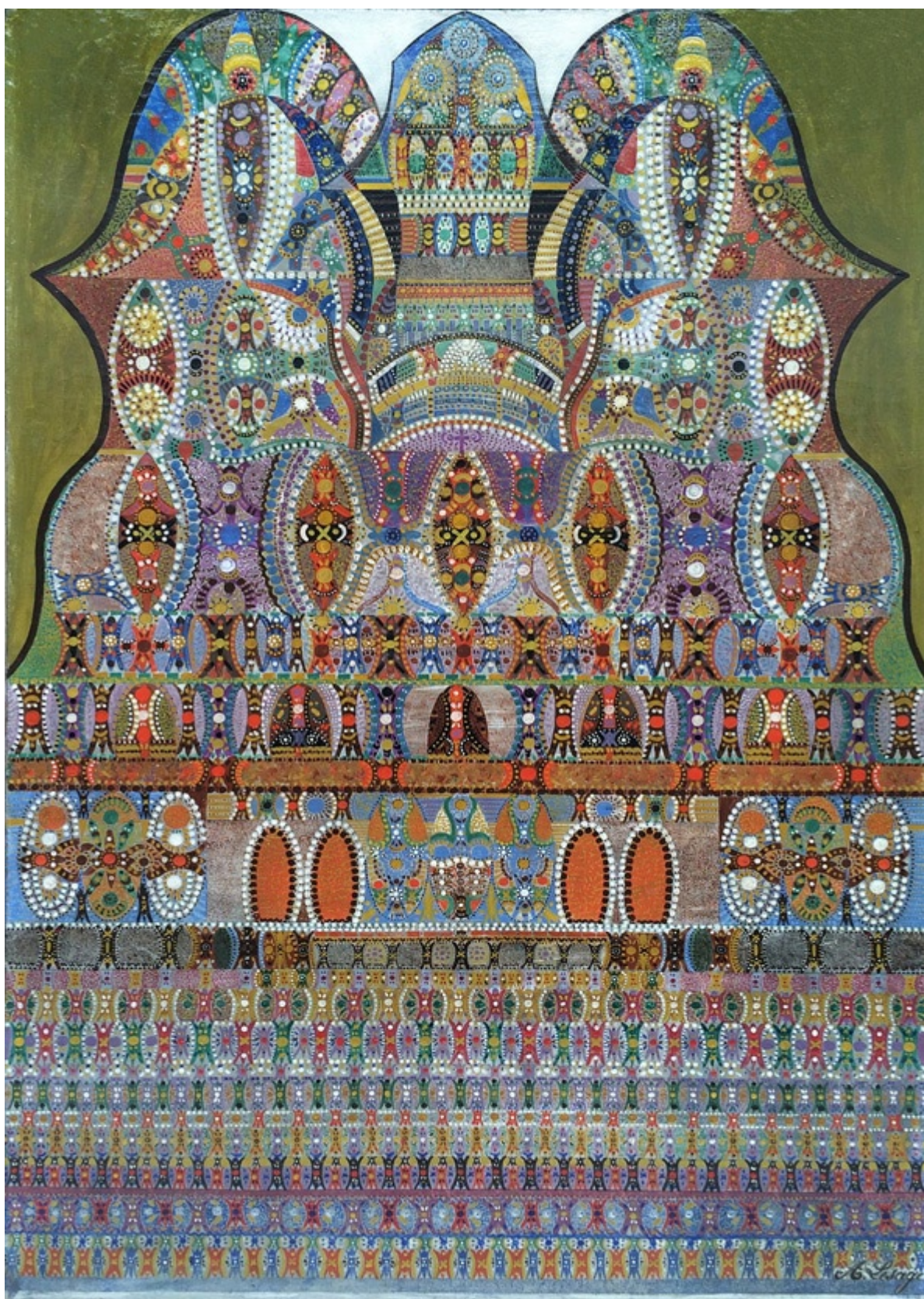
augustin lesage. sans titre, circa 1935. huile sur toile, 32 x 21.5 cm.