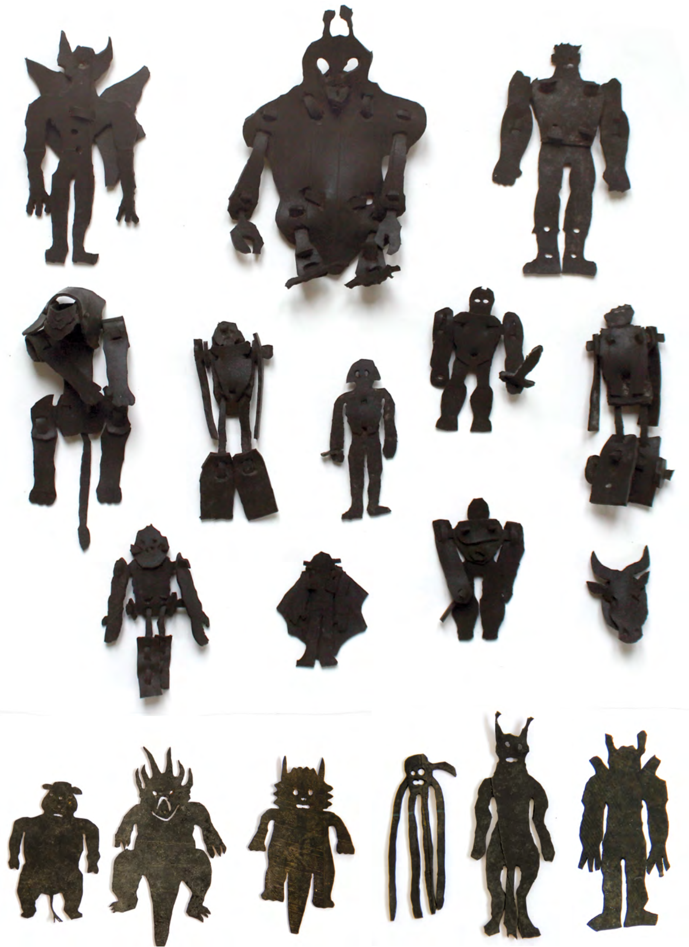
figurines en caoutchouc