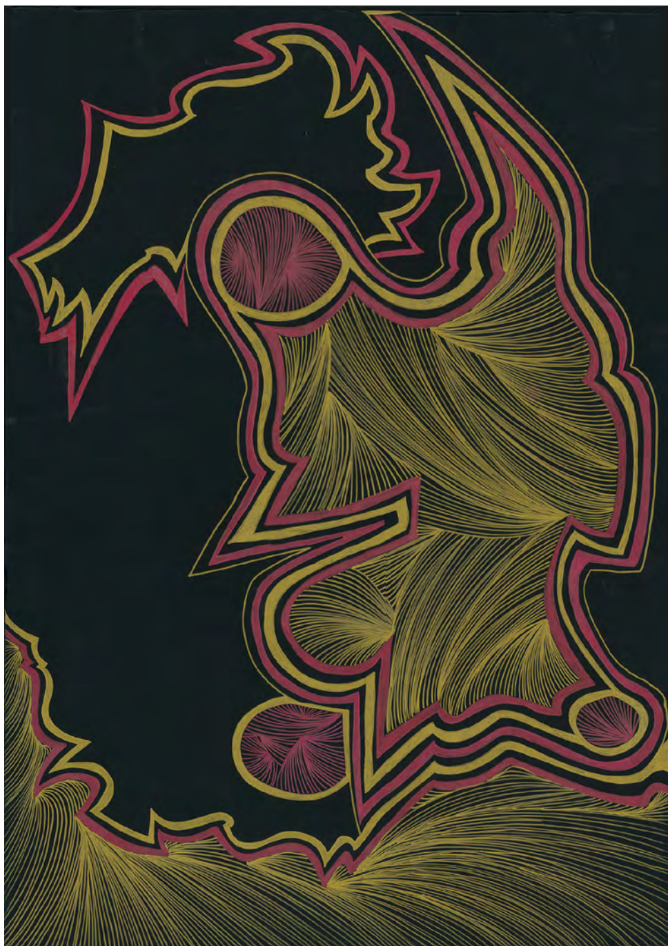
sans titre , 2019, feutres sur papier, 70 x 100 cm