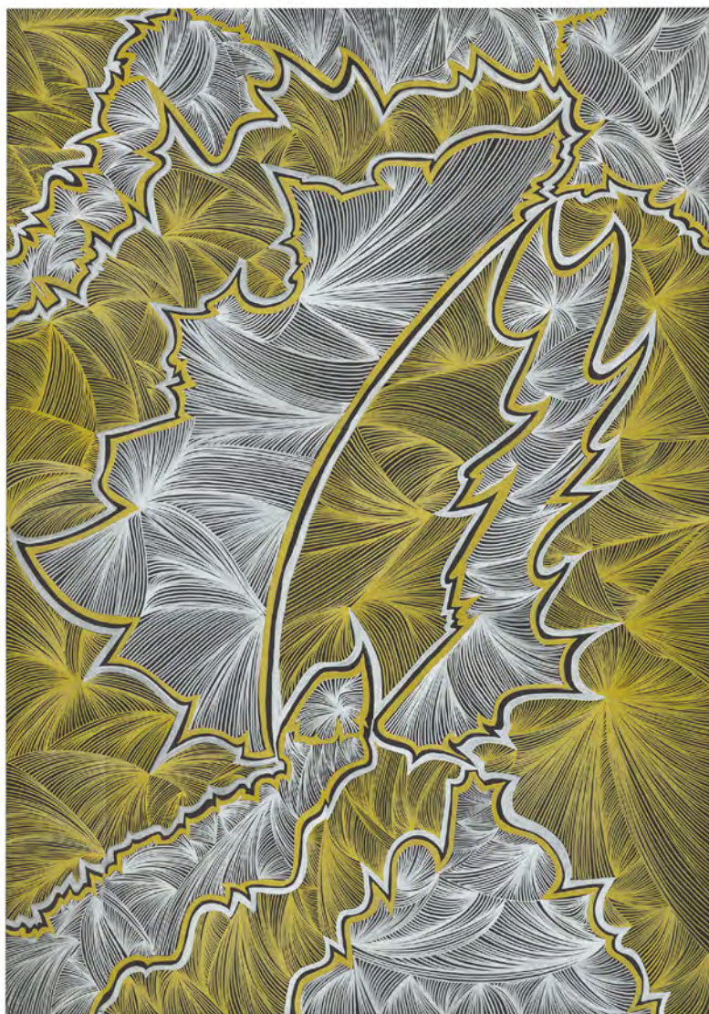
Le cri de Bach , 2019, feutres sur papier, 70 x 100 cm