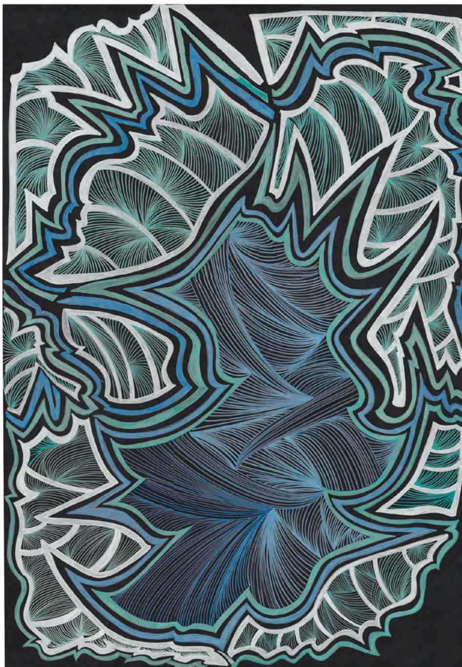
sans titre , 2019, feutres sur papier, 70 x 100 cm