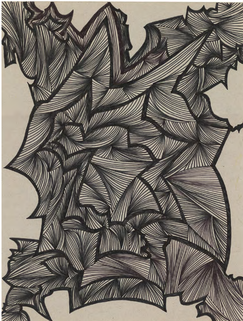
sans titre , 2019, feutres sur papier, 65 x 50 cm